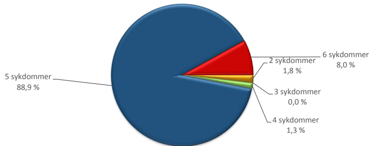
Doser av oljebaserte vaksiner til laks og ørret mot forskjellige sykdommer - 12 måneders rullerende omsetning